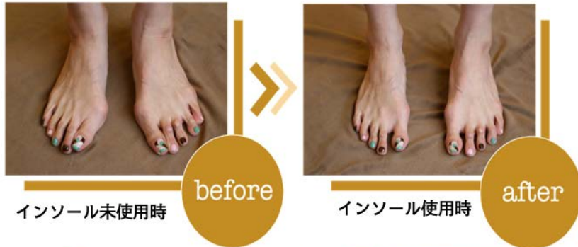
インソール未使用時